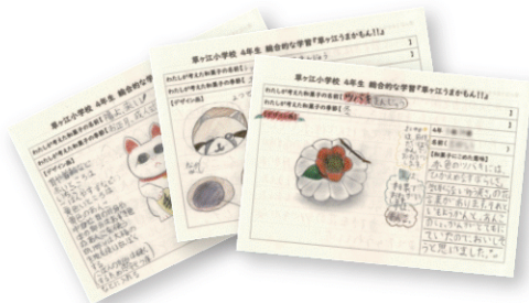
子どもたちの企画書