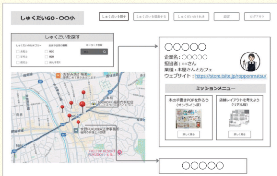
ミッション選択時のWebページ(※イメージ)