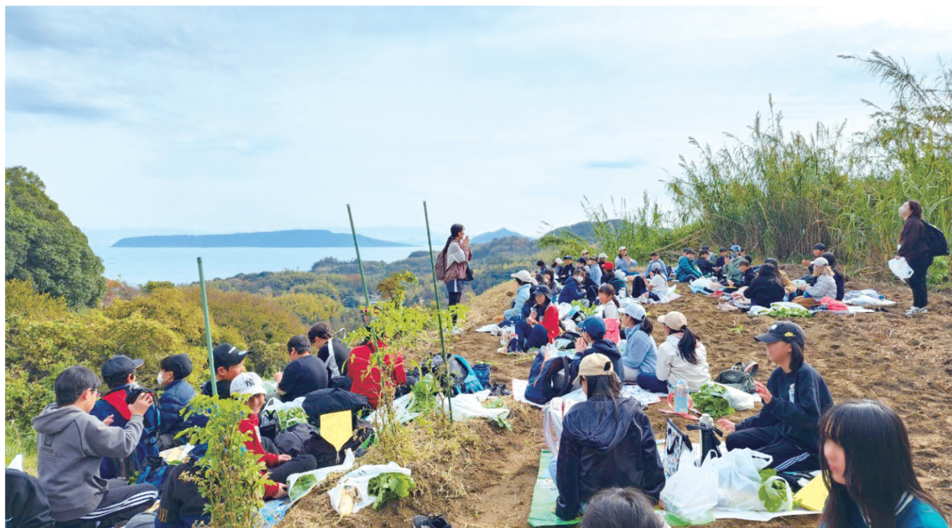
2024年12月13日(金)に実施された農家プロジェクトの様子。野菜を収穫してみんなうれしそう！